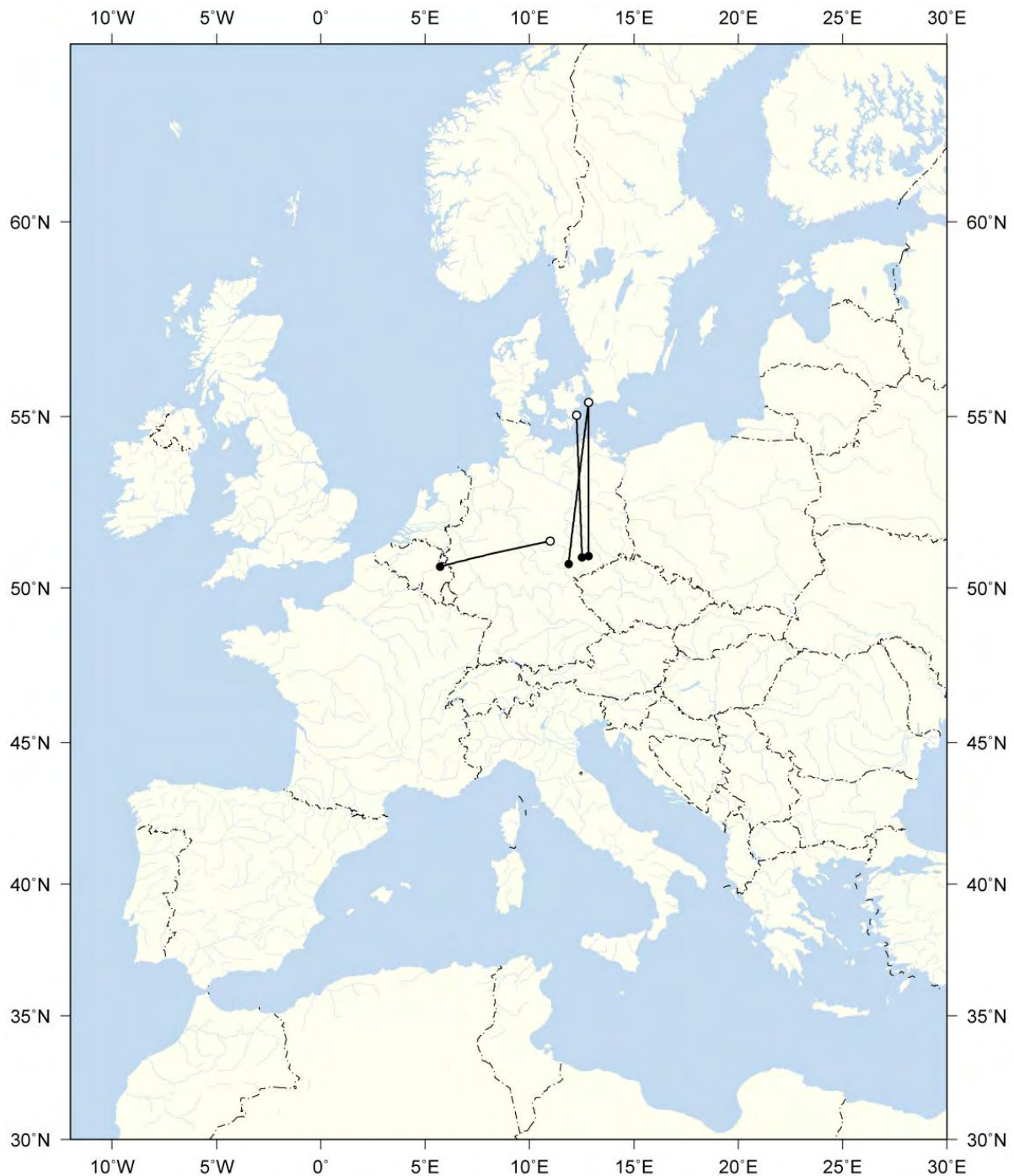
Abb. 3: Vier Fernfunde des Zaunkönigs

Es gibt bisher nur vier Fernfunde der Art in Thüringen. Drei Vögel wurden auf dem Herbstzug in Skandinavien beringt und im gleichen Jahr als Wintergäste in Thüringen kontrolliert. Ein weiterer Vogel wurde im August in Thüringen markiert und im Oktober in Belgien wiedergefangen, was darauf hindeutet, dass ein Teil unserer Brutvögel im Winter nach Westen ausweicht. Allerdings weisen sechs Funde von heimischen Brutvögeln bzw. hier erbrüteten Vögeln im Winter darauf hin, dass ein großer Teil unserer Brutvögel hier überwintert.